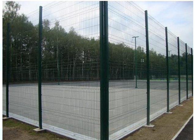
Таблиця 3. Розрахунок вартості влаштування огорожі футбольного поля.